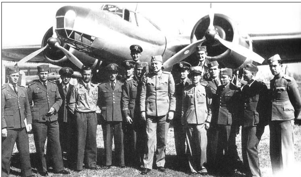
У Новом Саду 1938. године